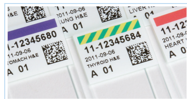
Printing only the slides you need, when and where you need them, helps avoid potentially serious patient safety errors.

Лаборантът след това сканира 2D баркода, отпечатан върху флакона, кутийката или друг съд, съдържащ пробата. Информацията, съдържаща се в баркода, автоматично се прехвърля върху слайда. Информацията може да бъде въведена и чрез клавиатурата или Touch-screen компютъра. След това, броят на слайдовете, поръчани за изследването, автоматично се отпечатват.