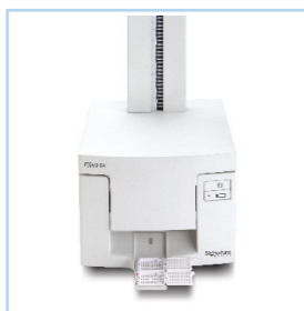
Принтер Signature Cassette

За подробни детайли и информация за поръчки в Европа се свържете с Primera Europe на тел. +49 (0) 611 92777-0 . Допълнителна информация за продуктите можете да намерите на адрес www.primera-healthcare.eu .