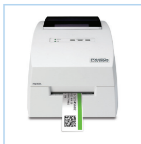
Принтер PX450e Specimen Label